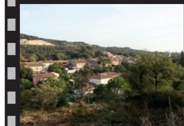
F. Hébraud, 2014