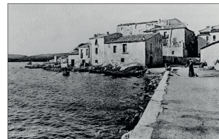
Bouzigues - 1905 Rivages de la Poterie Baylé Editeur