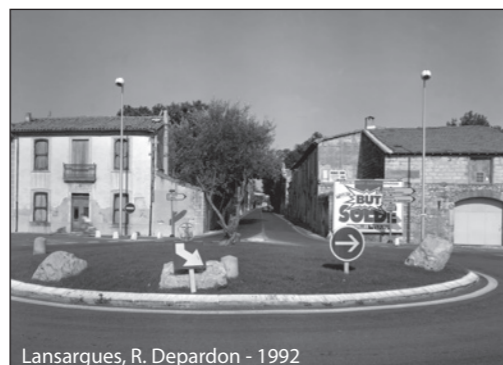
Lansargues, R. Depardon - 1992

Une perspective de rue marque l'entrée du village et invite à aller tout droit, alors qu'un obstacle en forme de giratoire s'y oppose. La valse annuelle des panneaux signalétiques et des rochers dissuasifs indique toutefois un problème. L'opportunité de ce giratoire serait-elle à remettre en cause ? Plus loin, la maison détruite fait place à un arrêt de bus. Sur les murs aveugles des trompe-l'oeil qui ne trompent personne.