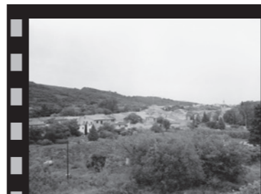
St Paul-et-Valmalle, R. Depardon, 1992

Les séries de l'Observatoire consacrent le paysage quotidien. Le regard subjectif devient juste et les images, partagées par tous, deviennent support d'échanges. La photographie libère la parole et prend du sens pour celui qui s'en fait l'interprète. L'image a le pouvoir de faire parler d'un espace que l'on fait sien par le simple fait de le regarder, tout comme l'architecture appartient à celui qui la regarde... Si les vertus citoyennes que l'on confère à l'Observatoire sont encore peu exploitées, en tant que révélateur, il est à même d'ouvrir un débat démocratique sur la construction du territoire et par là même d'un espace social.