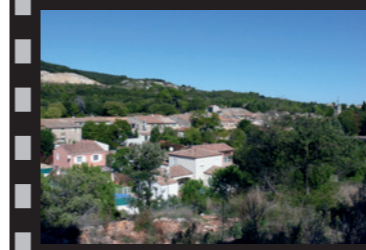
F. Hébraud, 2011