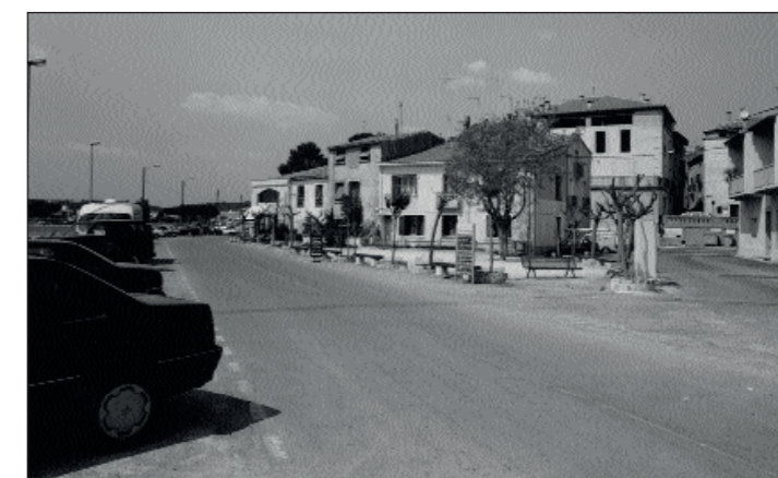
Bouzigues - 1995 L'Observatoire est un outil impitoyable. Il dénonce l'amnésie, facilite la prise de conscience des mutations urbaines. Ici, sous prétexte de modernité, on a oublié que c'est aussi à la qualité de ses espaces publics que se mesure l'accueil d'une commune.