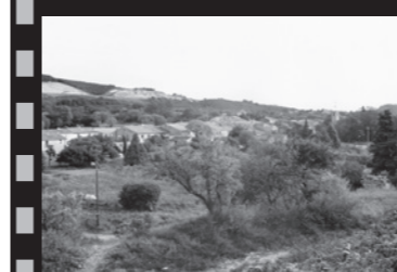
F. Hébraud, 2001