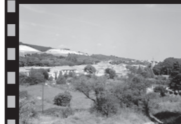
Reconduction F. Hébraud, 1997