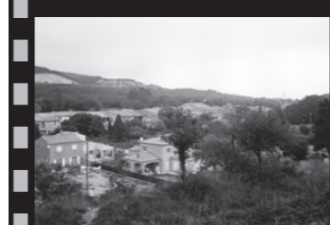
F. Hébraud, 2005