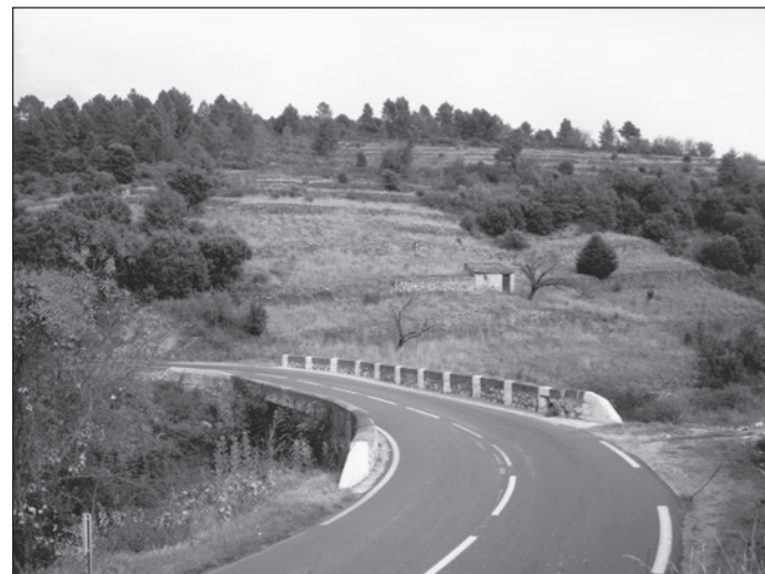
*Première prise de R. Depardon - 1992. Virage avant Colombières-sur-Orb

«Ces déplacements sont l'occasion de photographier d'autres sites qui ne sont pas dans l'itinéraire officiel, une sorte d'itinéraire «off» illustrant certains thèmes chers au CAUE : la déprise agricole, l'étalement urbain, l'aménagement du littoral...».