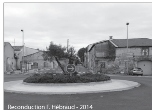
Reconduction F. Hébraud - 2014