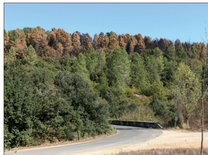
Reconduction F. Hébraud - 2017 La colline sur laquelle reposait l'appareil a été arasée. Progressivement, la végétation efface le travail des hommes.