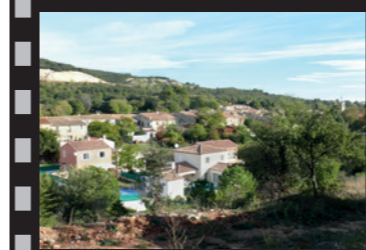
F. Hébraud, 2010