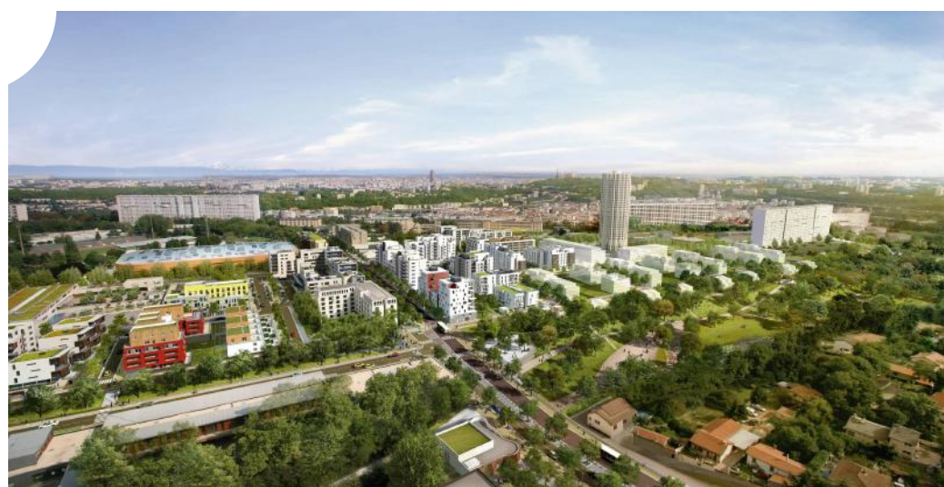
La Duchère avant / après