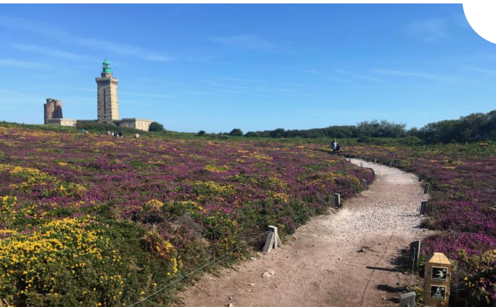
Le « ménagement » du Cap Fréhel © ALAIN FREYTET

Grande notoriété et forte protection, aménagements respectueux de la nature et des sols, Grand Prix national du paysage 2022.