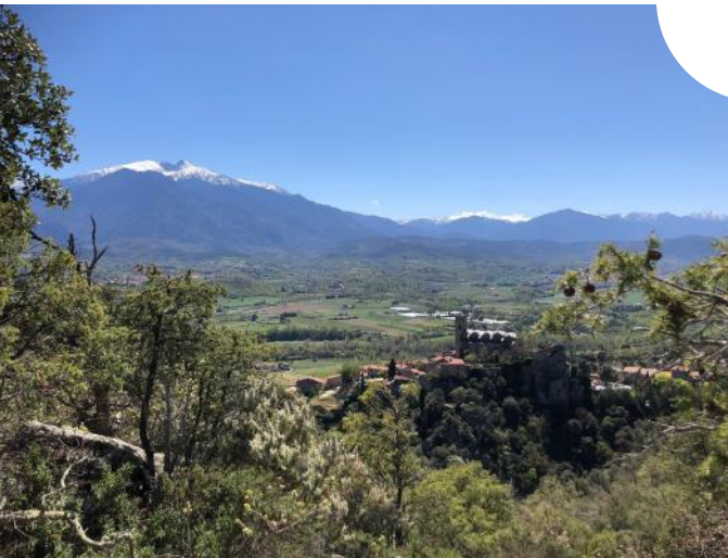
Le Canigó depuis les Albères

Le paysage partout, pour tous et toutes, pour une transition qui fasse du bien.