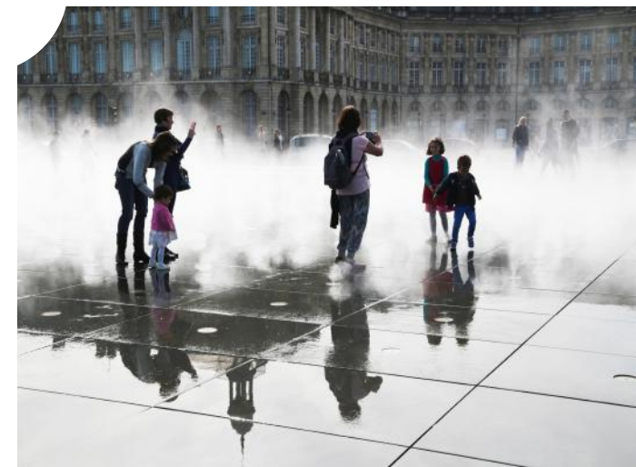
Le miroir d'eau, sur les quais de Bordeaux