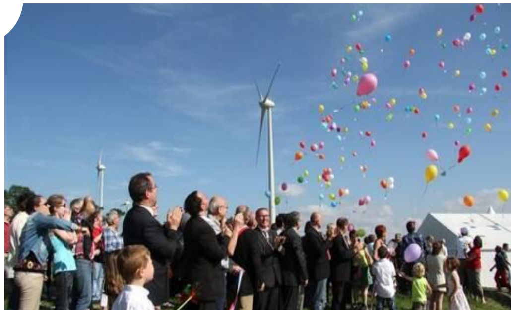
Energies citoyennes

Le territoire à énergie positive (TEPOS) du Mené : 7 communes a priori « sans qualité » devenues pionnières de la transition énergétique ancrée sur le territoire et portée par ses habitants.