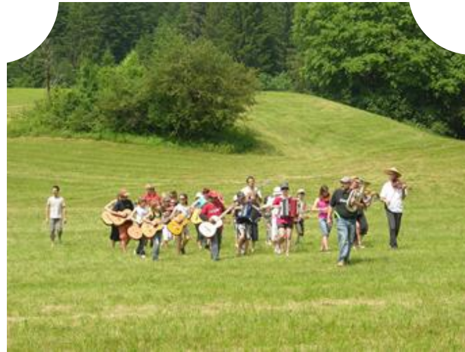
« Concert en sites sonores »