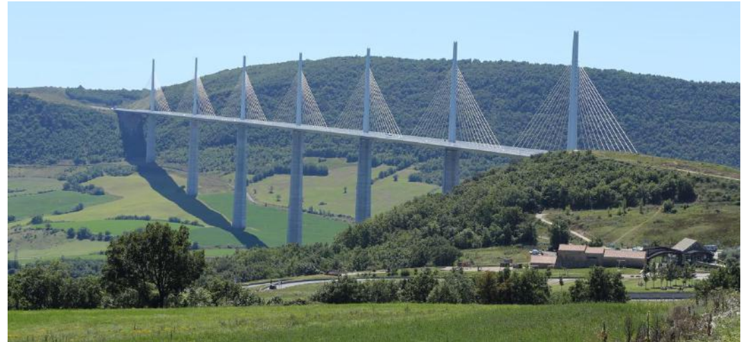
Le viaduc de Millau : nouveau paysage centré sur « l'ouvrage d'art »