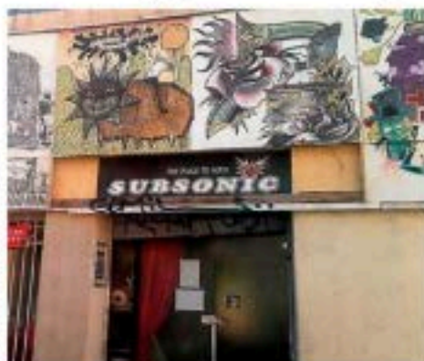
Tous les jours, la salle est entièrement gérée par des bénévoles.

Le lieu se métamorphose alors en un espace de création artistique, incluant ainsi un studio d'enregistrement et plusieurs salles de répétitions à la disposition de tous les intéressés. Événement très prisé par les locaux, les guitaristes ne se ferment cependant à aucune clientèle. Le rappeur Zamiane a, par exemple, élu domicile chez eux, pour répéter et