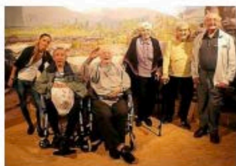
Sourires et souvenirs des seniors à l'issue de leur "exploration".