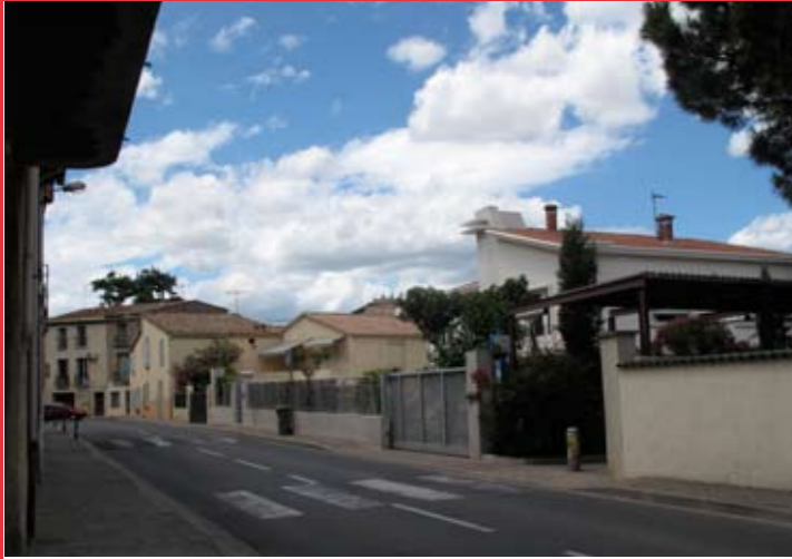
Depuis le boulevard Voltaire, l'accès au parc de stationnement est signalé par sa structure en acier qui contraste avec l'architecture domestique des villas.