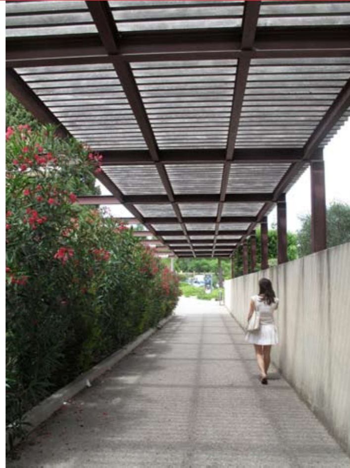
On quitte la vieille ville pour retrouver sa voiture en passant sous la pergola d'acier, bordée par des lauriers roses.

Les effets de ce nouveau fonctionnement se ressentent au sein des quartiers libérés des voitures, la vie sociale et commerciale est redynamisée. Les espaces publics du centre accueillent des activités attractives comme marchés, expositions... et les espaces patrimoniaux deviennent plus lisibles.