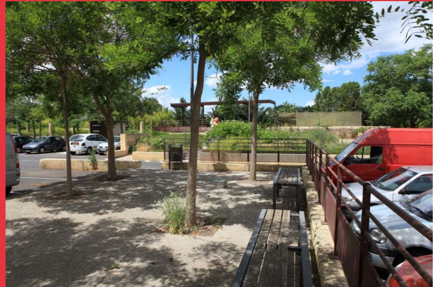
Un îlot central propose un point de repère et de rendez-vous à l'ombre des féviers d'Amérique (Gleditsia triacanthos 'inermis'), alors qu'un belvédère s'adosse contre les ouvrages de protection des crues de la Peyne qu'il surplombe. Sa structure en acier fait écho à celle qui recouvre le passage piéton rejoignant le centre.