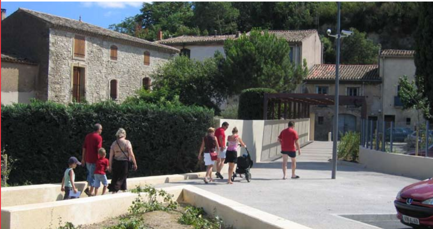
La liaison avec le centre de Pézenas se fait par un passage qui assure aux piétons un déplacement en toute sécurité. Un écran végétal borde le cheminement couvert d'une ombrière dont la structure métallique signale le passage.