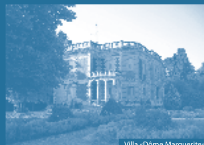
Villa «Dôme Marguerite»