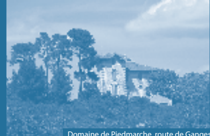
Domaine de Piedmarche, route de Ganges