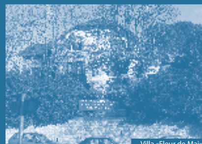
Villa «Fleur de Mai»