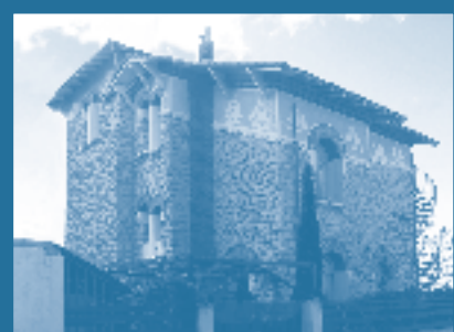
Villa «Petits Bateaux» à Carnon